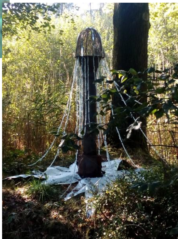
Maar op 29 september vonden we enkel dit "kunstwerk"