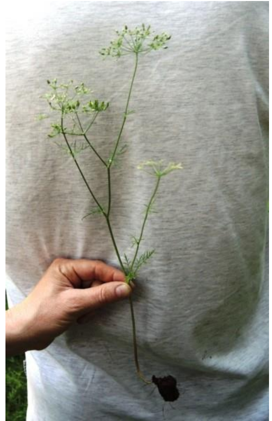
Op 8 juni gingen we in het Hobos terug op zoek naar de Franse aardkastanje en met succes