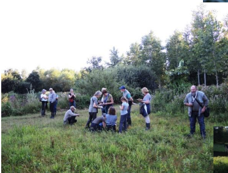
Op 17 augustus waren we te gast in de Holen. Altijd weer de moeite waard