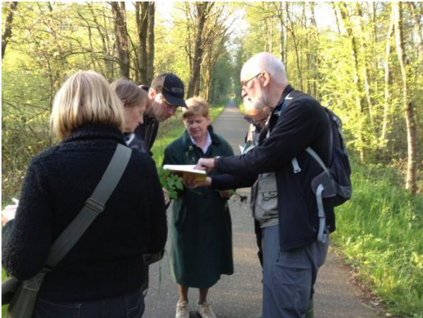
We waren mei gestart en het moest juist zijn