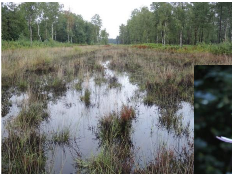
Ook augustus startte in een natte heide