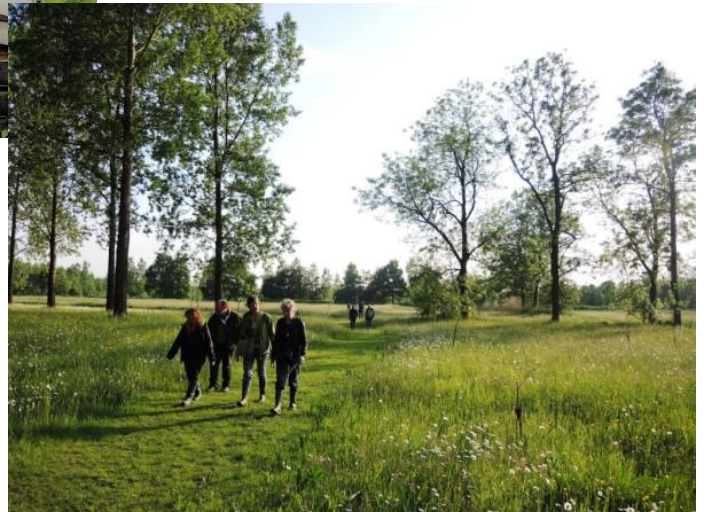
Een rustige wandeling in het Hageven sloot mei af