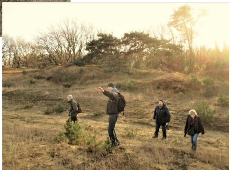
Op 27 december liet Theo ons een ander stukje van den Brand zien en werd het slobkousjaar afgesloten