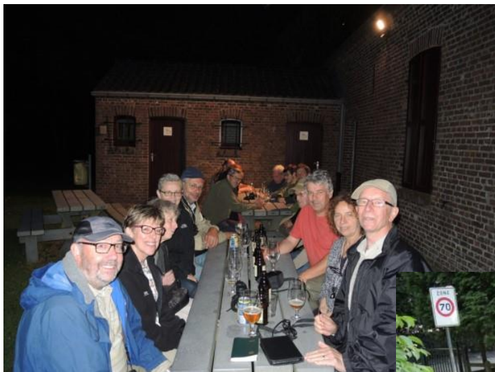
Op 6 juni kwamen onze vrienden van het SAP clubje op bezoek en werd er nog lang nagepraat over plantjes (?)