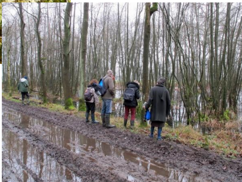
Op 23 februari waren rubber botten geen luxe