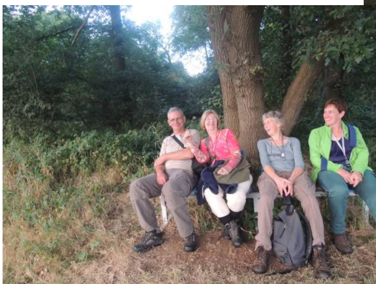
Op 31 augustus werd het plantenseizoen gezellig afgesloten