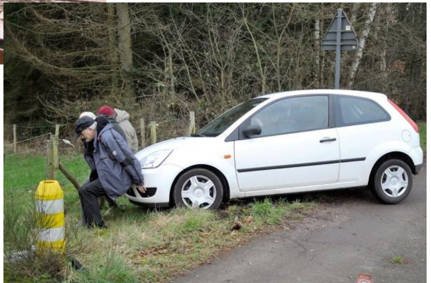
De laatste wandeling van de maand moest er eerst gedepanneerd worden