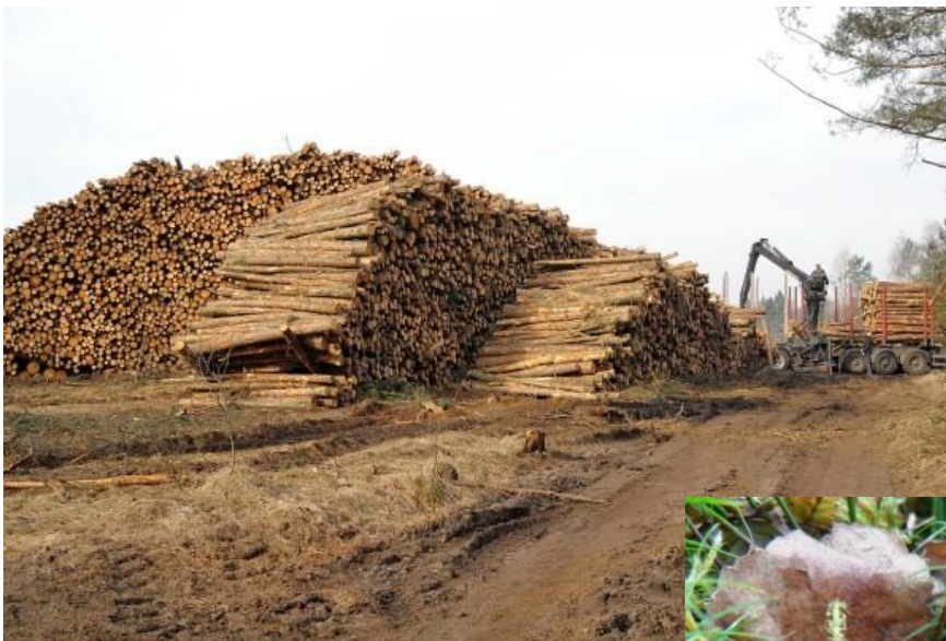
15 maart en stookhout voor een leven