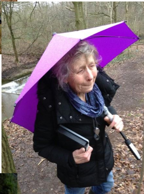
Op 9 februari was de paraplu eerder om te showen