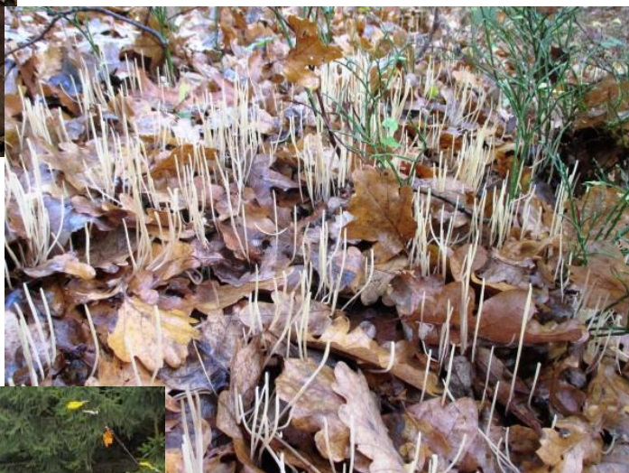
Op 8 november kon je moeilijk naast deze knotszwammetjes kijken