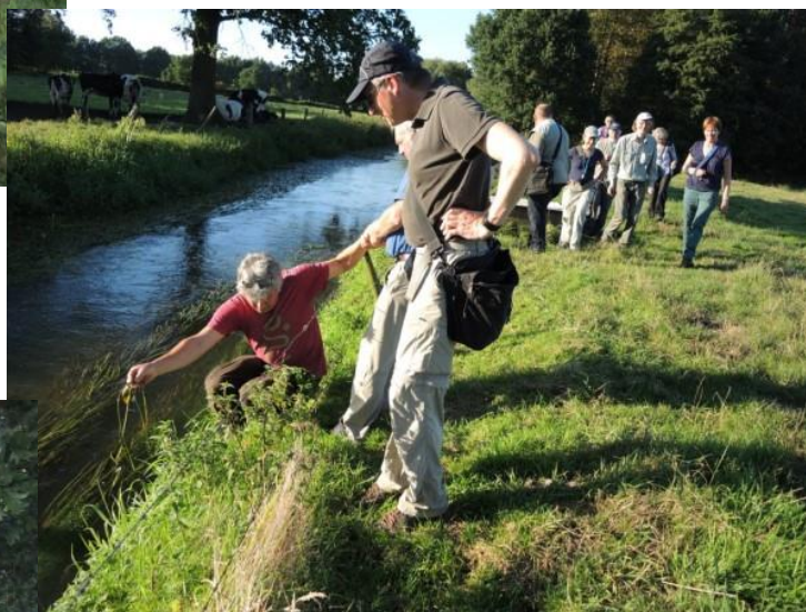
Ja drijvend fonteinkruid groeit nu eenmaal niet in de weil!