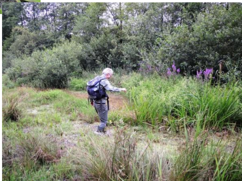
Een slobkous moet soms risico's nemen