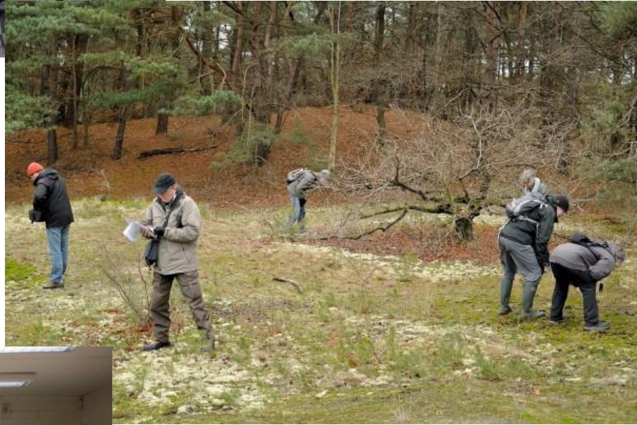
Op 12 januari was het wat ieder voor zich lijkt het wel