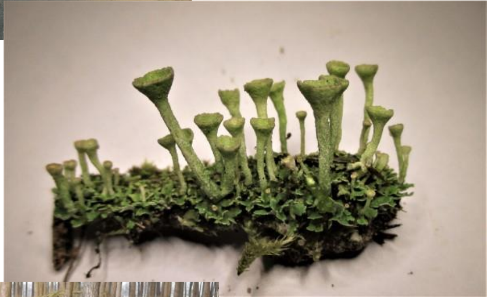
Op 13 december determineerden we dit als kopjesbekermos