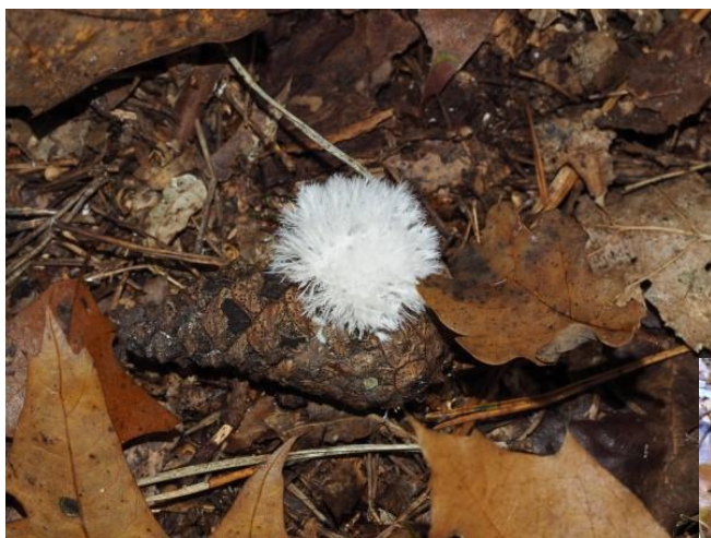
sphaeropsis sapinea op dennenappel NP was een minder leuke vondst