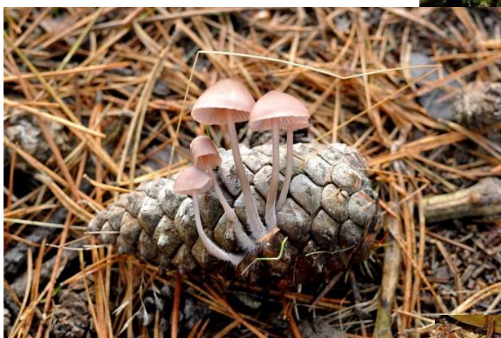
En op 17 oktober deze zeedenmycena