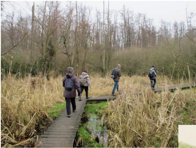
Gelukkig lag er in Reppel een plankenpad want ze waren deze keer hun botten vergeten