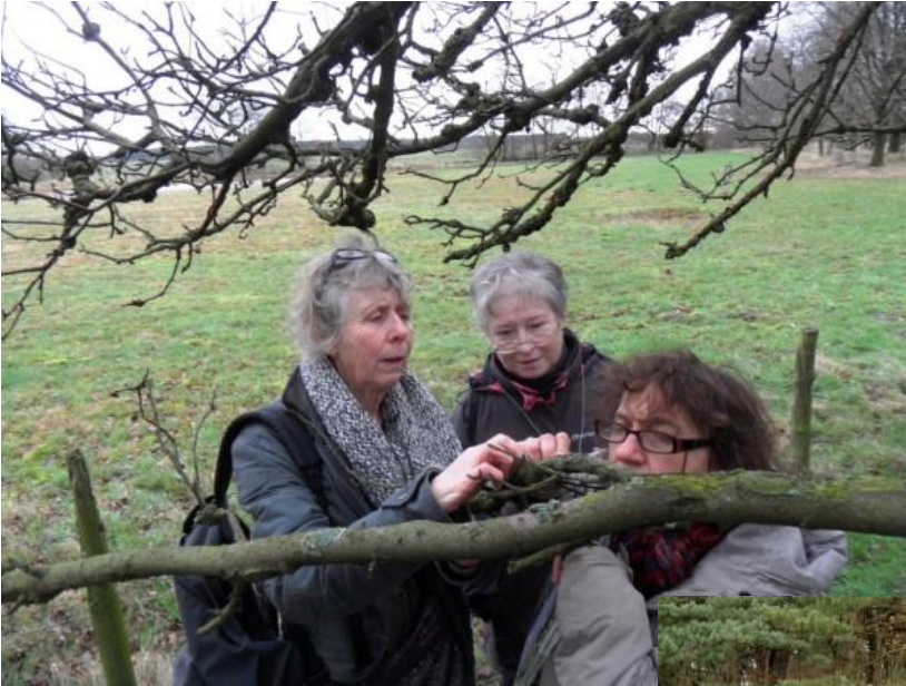
Alles begon op op 5 januari met het besnuffelen van bomen