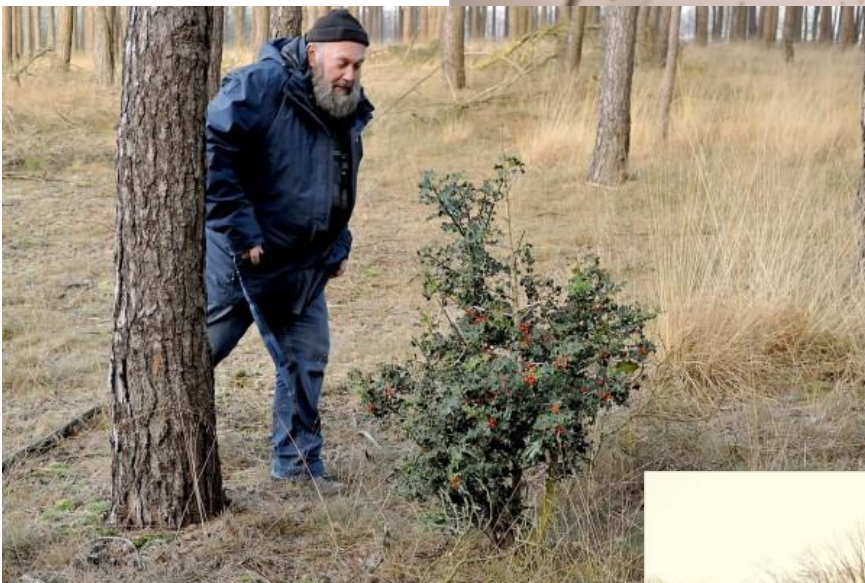
Op 20 december kwamen we deze kerstversiering tegen