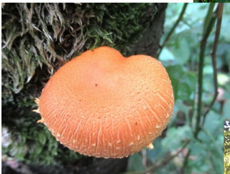
Het werd stilaan tijd voor de paddenstoelen