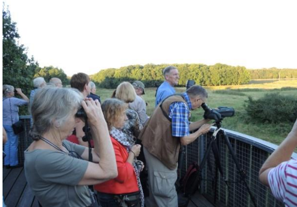
Op 7 september kropen we op de uitkijktoren om de herten te horen burlen en we waren er niet alleen