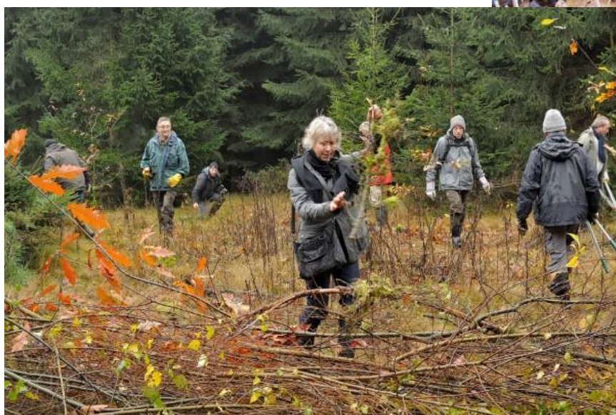
Op 15 november was het werken geblazen in het sparrenbosje