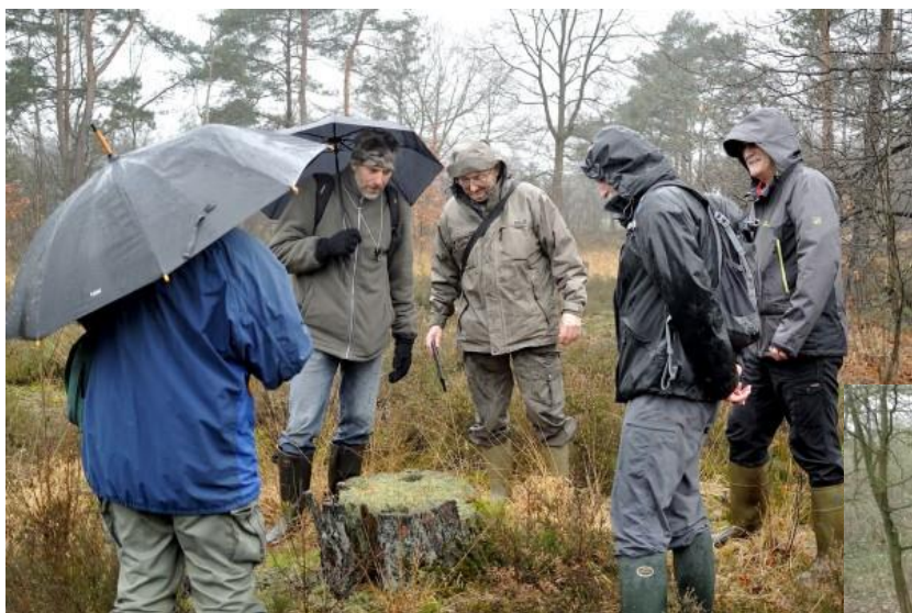
Februari werd natjes ingezet