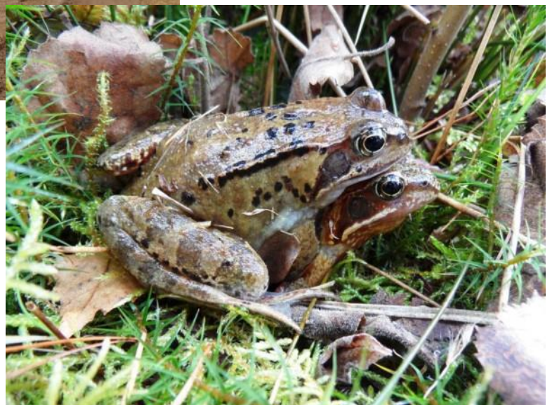
Op 22 maart kregen we toegepaste seksuele voorlichting