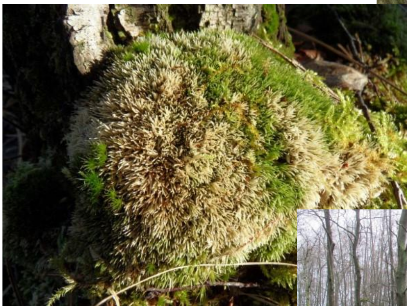
Op 16 februari vonden we dit kussentjesmos