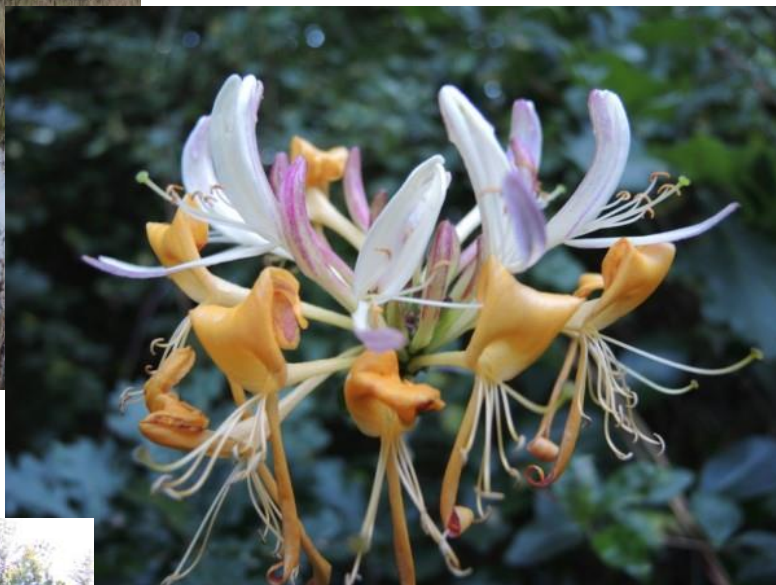
Op 10 augustus stond de wilde kamperfoelie ons toe te lachen