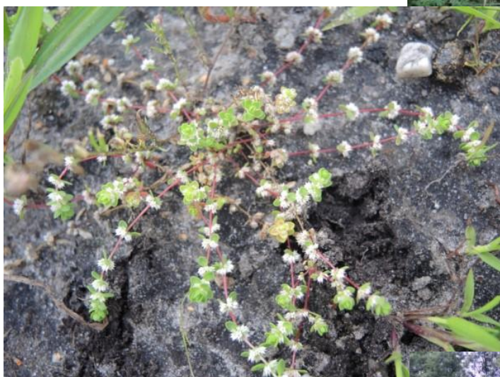
Op 20 juni vonden we deze grondster langs een wegbem