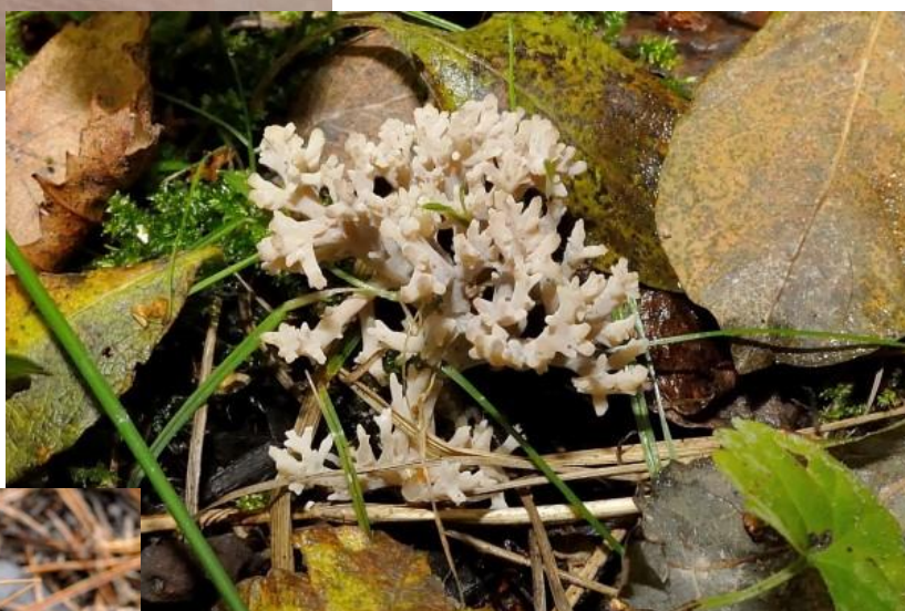
Op 11 oktober vonden we deze witte koraalzwammen