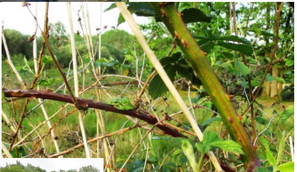
Op 11 mei gingen we luisteren en kijken naar de boomkickers