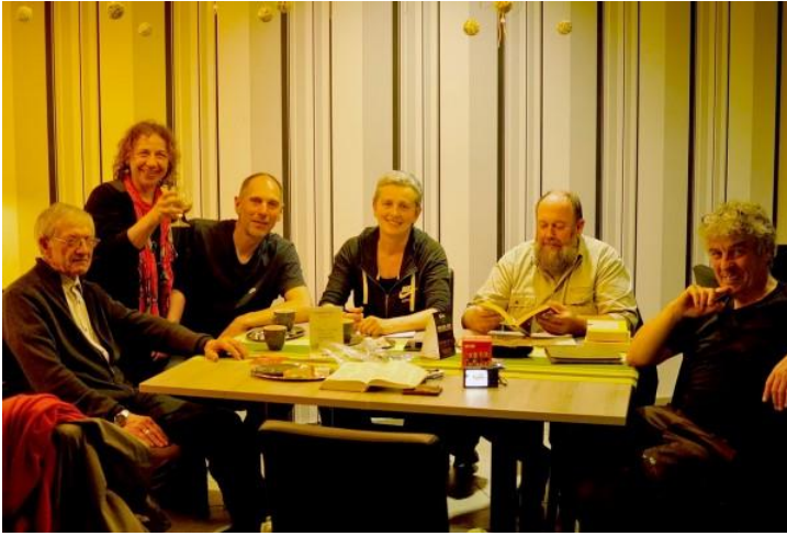
Zo begon juni zagezegd omwille van de regen!