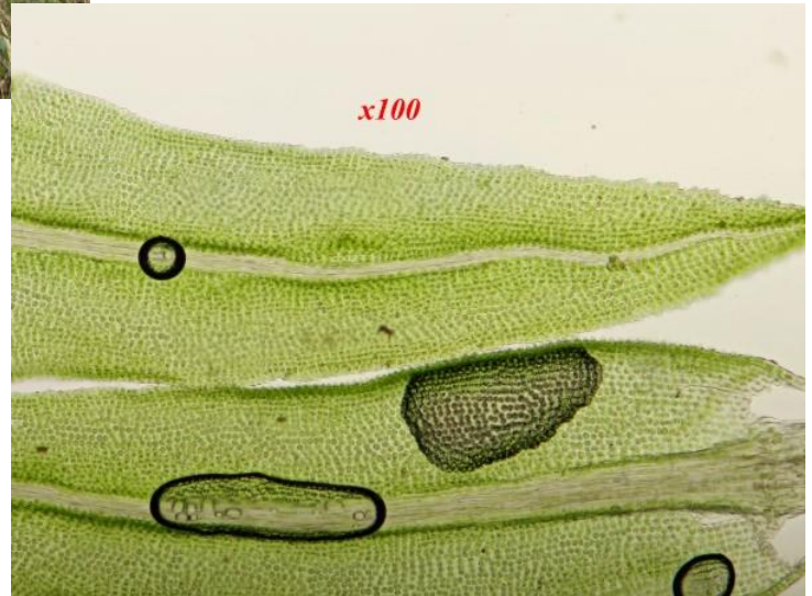
Het gewoon knopjesmos dat we op 8 maart vonden werd door Luc eens van heel dichtbij bekeken