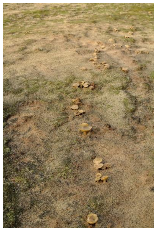
Op 22 november moest je opletten om geen gele ridderzwammen plat te trappen