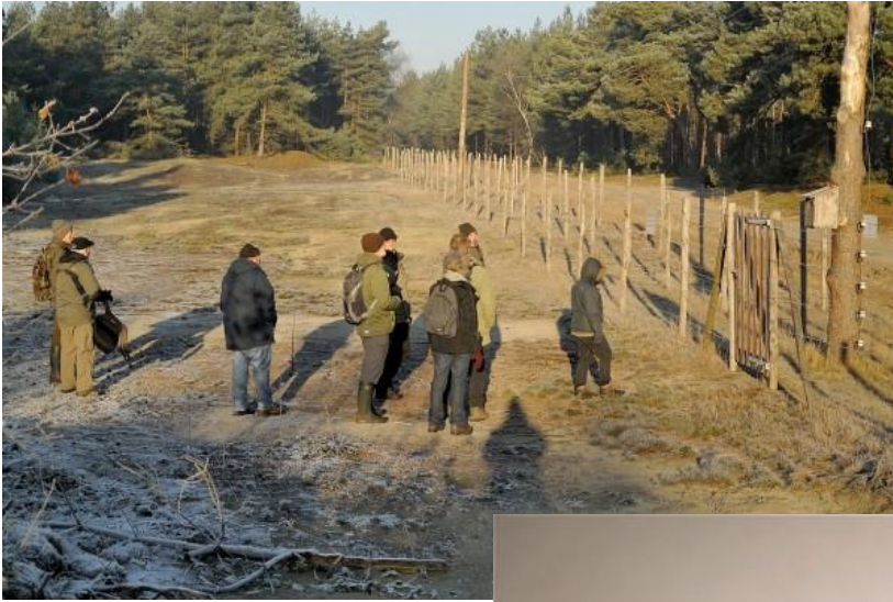
Op 6 december stonden we oog in oog met den dodendraad