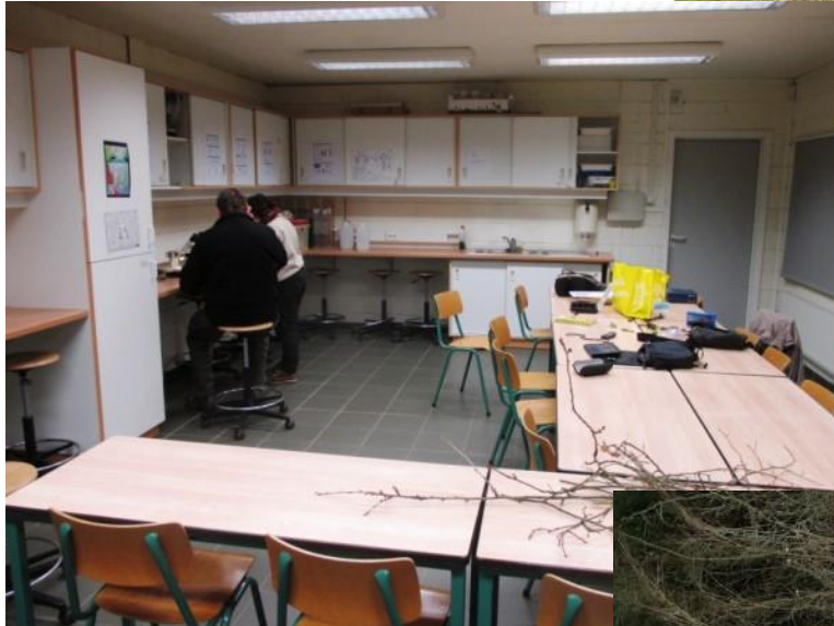
Op 20 januari werd er aan wetenschappelijk werk gedaan