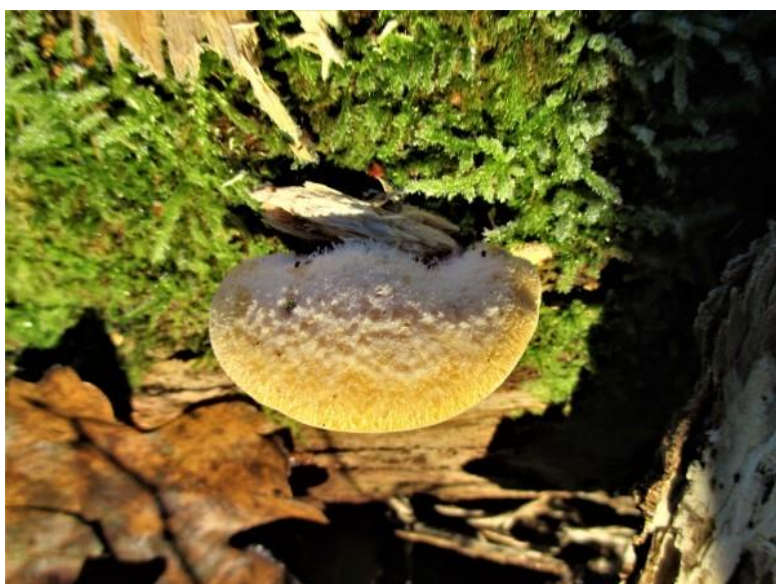
Met deze gele oesterzwam sloten we de maand af