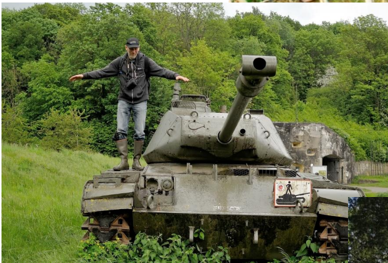
Op 18 mei waren er die heimwee kregen naar hun legerdienst