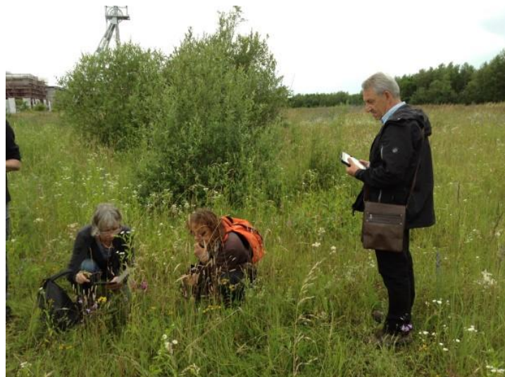
Op 29 juni was het speciale zoeken op de terril in Waterschei