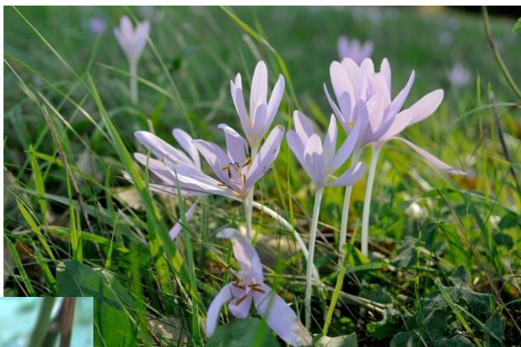
Op 13 september liepen we tussen de herfstijlloos